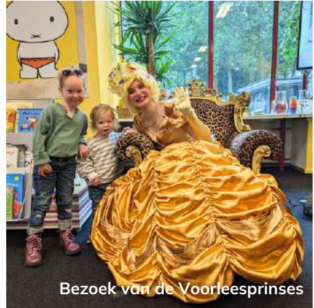
Bezoek van de Voorleesprinses

Tijdens de BoekStartdag ontvingen we voor het eerst onze Voorleesprinses en gaven we ouders voorleestips om het voorlezen thuis te stimuleren.