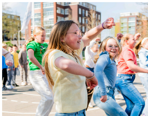
Kinderen van de Julianaschool dansen op 'Kom van die bank'.

● We organiseerden de Planck Droom Weken. Maar liefst 291 mensen vulden de online enquête in en deelden hun ideeën, wensen en dromen. Ook in de vestigingen werd volop meegedacht. De Droom Weken leverden waardevolle inzichten op. Zo voelt 78% van de deelnemers zich zeer welkom bij Planck, en bezoekt bijna de helft al regelmatig activiteiten.