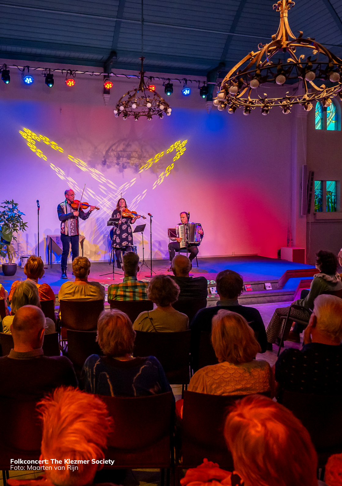
Folkconcert: The Klezmer Society